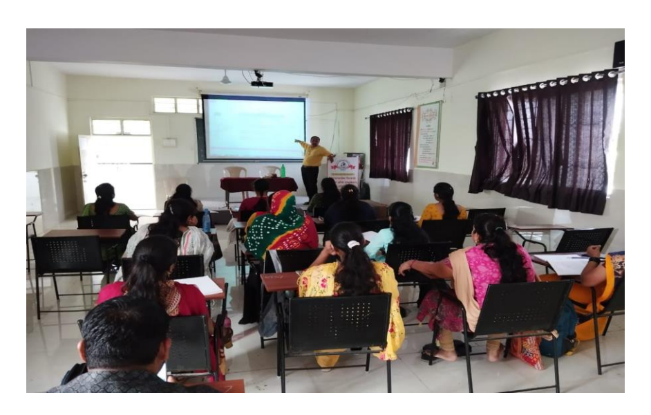
Art education /teaching aid work shop