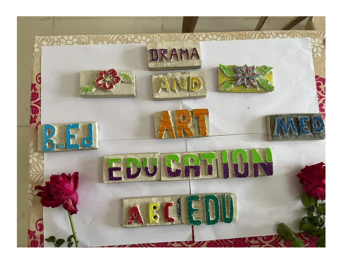
Teacher enrichment workshop